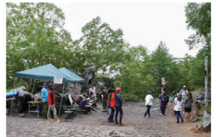
写真1 吉田ルート 泉ヶ滝でのアンケート調査風景

得ました。このうちアンケート記入に回答不備がみられたものを除いた529人の回答を有効回答としました(有効回答率74%)。登山中に転倒したと答えた人は529人中196人(転倒者率37%)でした。複数回、転んだ人もいたため延べ転倒発生回数は640回、3回以上転んだ人は74人でした。2018年の同様な調査では、転倒者は556人中167人、転倒者率30%、延べ転倒発生回数は