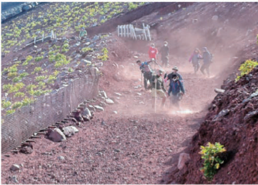
写真2 吉田口登山道の下山道の風景