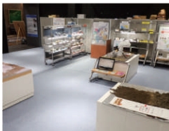
富士山サイエンスラボ