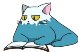
富士山科学研究所キャラクター けんによるび