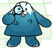
富士山科学研究所キャラクター ふじさん犬