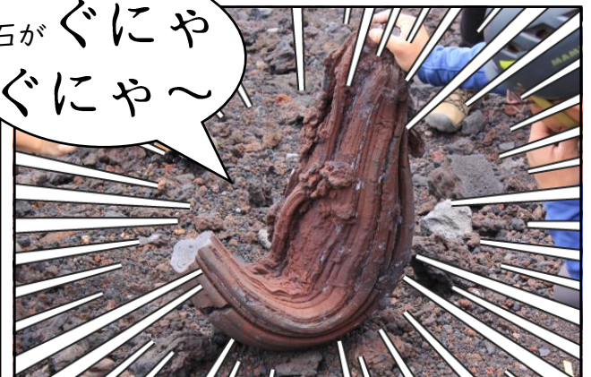
宝永噴火で飛び出した火山弾